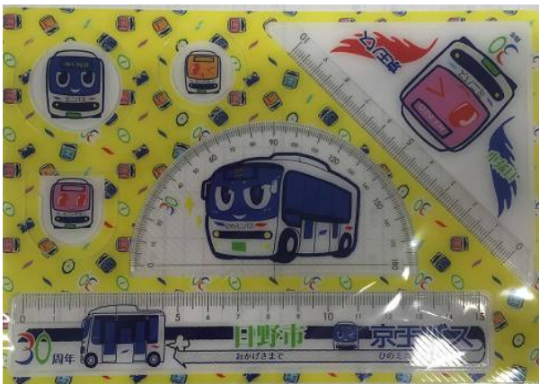
うちわ・文具セットデザイン