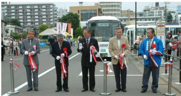
川辺堀之内路線 開設式の様子

川辺堀之内路線は昨年5月16日に運行を開始しました。3月までの11ヶ月間の延べ利用者数は39,772人です。(1日平均125人)