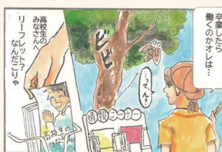
漫画・イラスト：絵画教室じゅうちょう