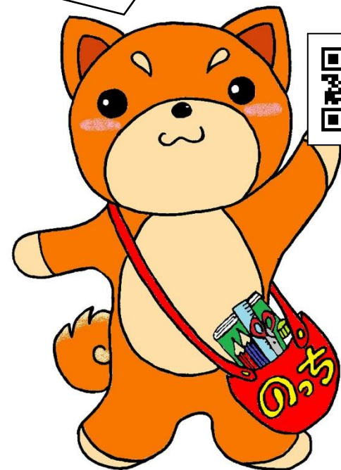
日野市放課後子ども教室公認キャラクター「のっち」

ぼくのTwitterでは、ジュニアリーダー講習会の様子や、子育て関連情報をつぶやいているよ！ よかったらのぞいてみてね！