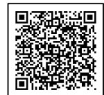
日野市ホームページQRコード

<お問い合わせ> 子ども家庭支援センター母子保健係 電話：042-843-3663