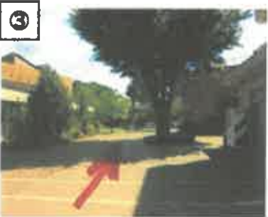
③ 大きなケヤキ左横を通り過ぎてください