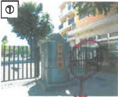
① 正門右側の通用門からお入りください