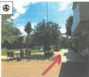
④ そのまままっすぐ進んでください