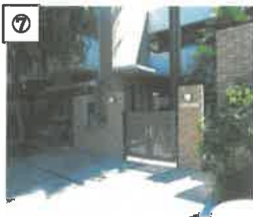
⑦ 左側の事務所が見学受付場所です