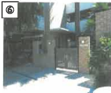
⑥ 至誠学園の門からお入りください