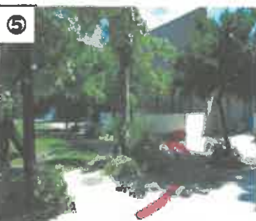
⑤ 突き当りを左に曲がってください