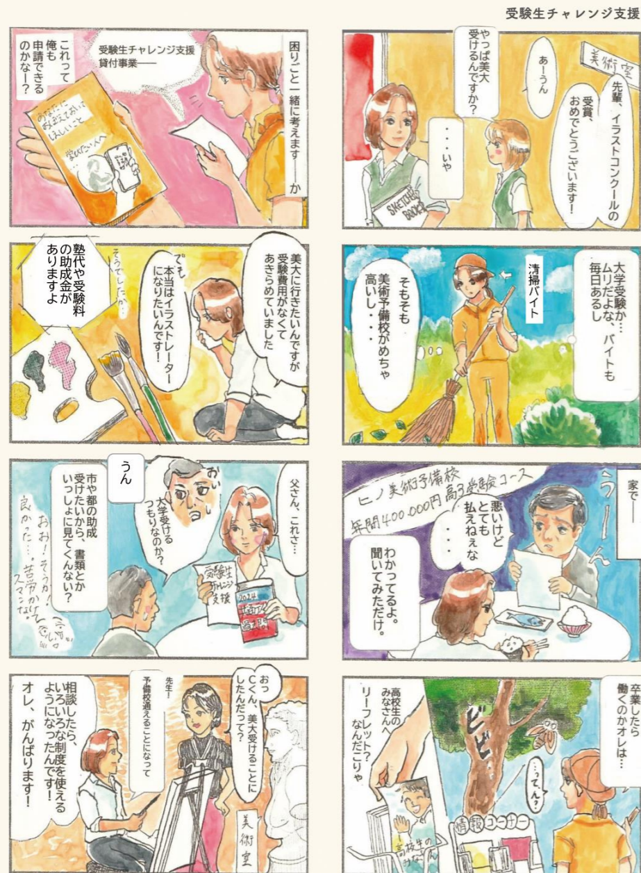
漫画・イラスト：絵画教室じゅうちょう