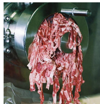
＜食感が良い挽肉 ミンス＞

当社は挽肉機械・ミキサーグラインダー・骨肉分離機・スクリーコンベアなど、「大ロット用産業向け」食肉加工装置の設計から製作・メンテナンスまでを行っています。