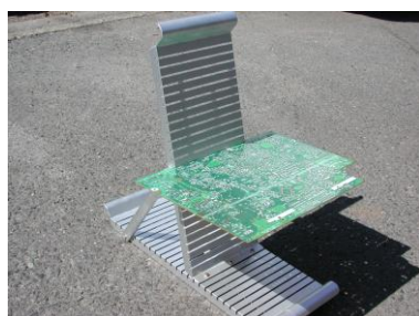
＜斜めアルミラック＞