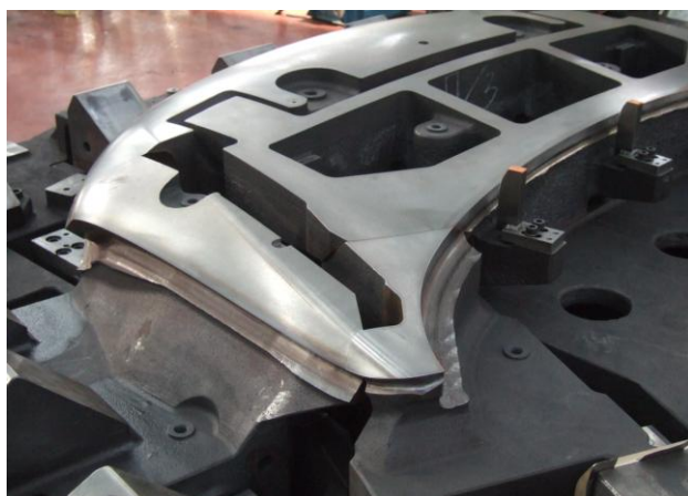
◆左側が実物の金型で、自動車のボンネットの型

弊社は自動車の新車開発における、板金プレス金型に特化した設計をしております。自動車メーカーが車のデザインを行い、工場を選定した後、ドアやボンネットなどをどのようにプレス加工してこの形にしていけるのかの具体的な方法を考えるのが設計の仕事です。