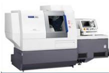
シスノマシナリー M32