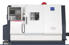
シスノマシナリー BNE42