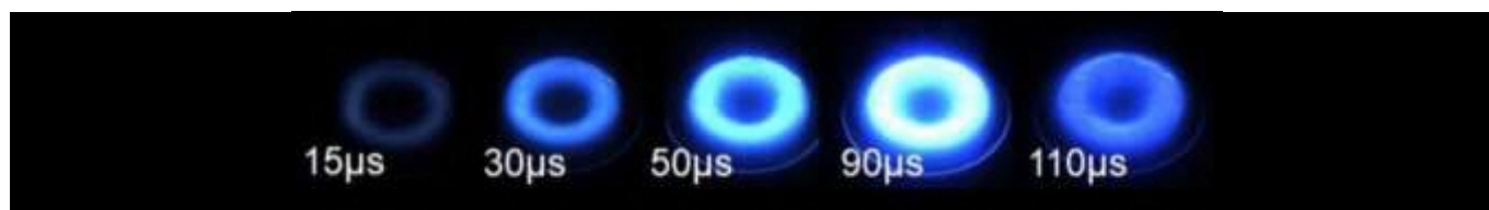
図1 高速度カメラにより撮像した大電力パルススパッタにおけるパルス放電の時間推移

2000年代初期に開発された大電力パルススパッタリング(通称HiPIMS)技術におけるプロセス制御の柔軟性を活かした高能薄膜プロセスの開発を進めています。パルスプラズマにおける過渡的なプラズマ特性を把握する事で従来困難であったプラズマ中のイオン粒子の制御が実現されます。これによって、従来の単層膜構造の概念を打破する新しい膜構造の可能性が広がり、相反する薄膜の物理的・機械的特性が実現されます。これまで、製造技術、電子半導体、医療機器、環境エネルギー技術の各種分野における各種遷移金属窒化物、酸化物薄膜材料、ナノ粒子の形成を実現してきました。