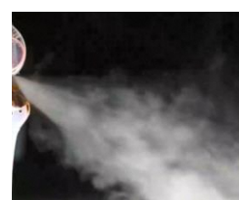
アクチュエータ起動後