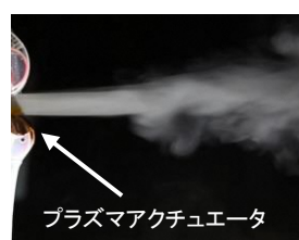
アクチュエータ起動前