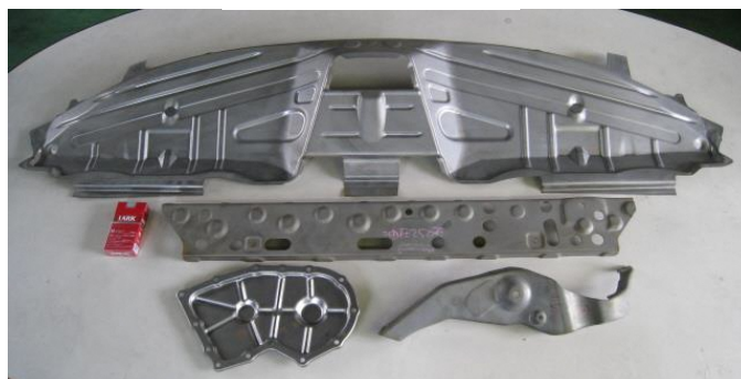
様々な形状(自由曲線)・材質・板厚に対応します。