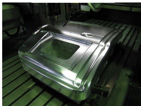
写真は自動車スライドドアの成形型です。