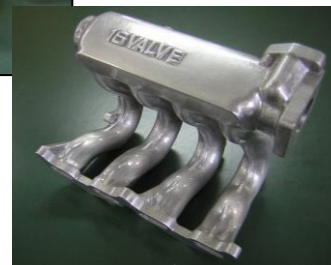
<アルミ鋳造品:複雑形状、中空>