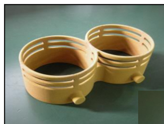
<中子完成品: 複雑形状、 厚さ3mm>