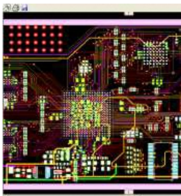
<多層基板の設計例>

高周波基板、パワースイッチング電源などの電源基板、アナログ/デジタル混在基板、ハイビジョン用基板、PCIバス基板、制御系基板など