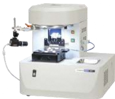
< 外観 >