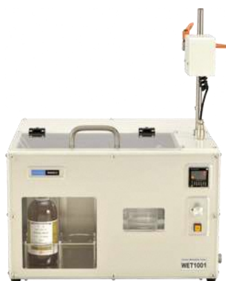
< 外観 >