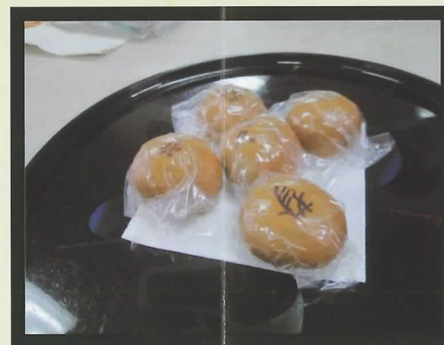
▲スタッフ手作りのおまんじゅう