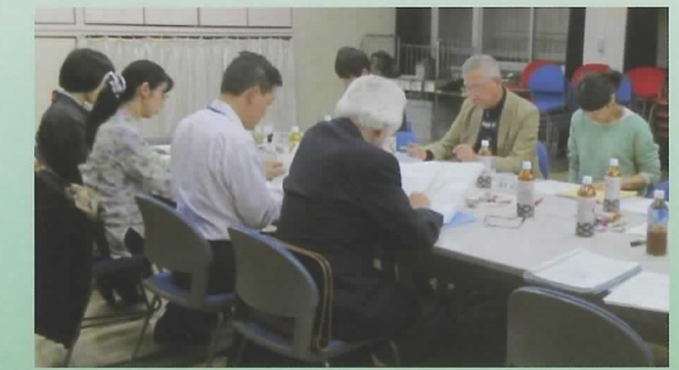
▲アクションプラン検討会当日の様子

ここに参加してくれている方々は、地域を愛し、より良くしたいという一致した思いで集まっているため、活発な意見が数多く出されていました。今後は地域のみなさんが無理なく、一緒にできるようなプランを考えていきます。地域の方が考えたプランを、地域の方が実践し、地域の発展に役立てられたら、とても素晴らしいことだと思います。