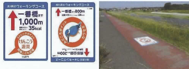
☆みどころポイントは、地域懇談会での意見を参考とさせていただきます。

その中の取り組みの一つとして、歩くときにチェックポイントとなる公園や橋などへの距離と消費カロリーのウオーキングサインを設置しました。見どころポイントを示したものなど、いろいろなウオーキングサインがありますので、ぜひ歩きながら探してみてください。