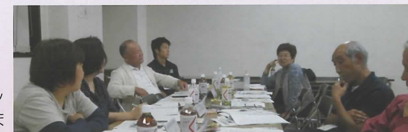
▲アクションプラン検討会当日の様子

ここに参加してくれている方々は、より良い地域にしたいという一致した思いで集まっているため、活発な意見が数多く出されていました。今後は地域のみなさんが一緒にでき、わくわくするようなプランを考えていきます！そのプランは、次回地域懇談会でお披露目となりますので、ご期待ください！