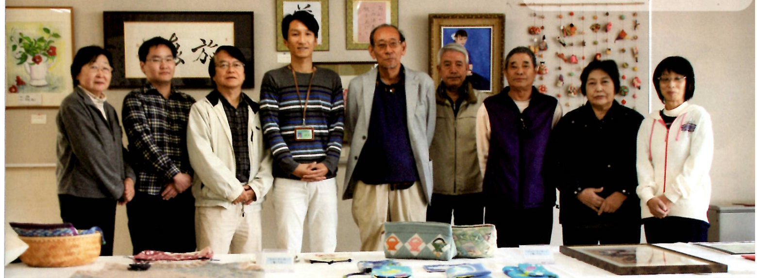
▲日野新坂下住宅管理組合自治会の皆さん

■発行日/平成28年5月 H28年 通算第19号 ■発行・編集/日野市企画部地域協働課 〒191-0011 日野市日野本町 1-6-2 ■電話/042-581-4112