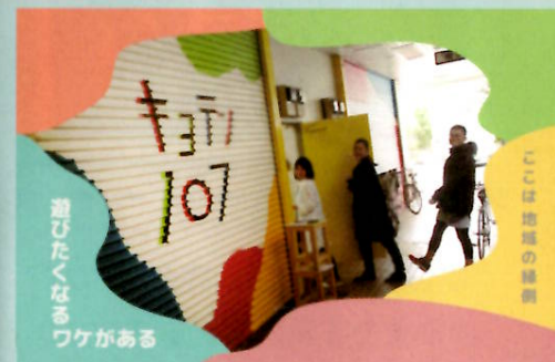
▲「キョテン 107」 JR 日野駅から徒歩3分 日野本町 3-12-8 サニーハイツ'80 107号室

キョテン 107 は、実践女子大学、日野駅周辺飲食店、日野市民、日野市とが連携して行っている「日野宿通り周辺『賑わいのあるまちづくり』プロジェクト実行委員会(通称:ひのプロ)」が運営している、地域の新しいコミュニティスペースです。このシャッターの向こう側では、若者が中心となって様々な人が集まり、日野の「おもしろ!」を考えています。そんな、新しくワクワクする、可能性溢れる地域の拠点(キョテン)をご紹介します。