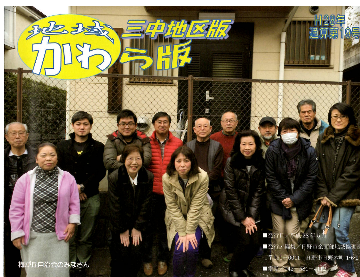
梅が丘自治会のみなさん

■ 問合せ先 電話：042-585-1111（代表） 日野市 総務部 防災安全課 内線7745・7746 健康福祉部 高齢福祉課 内線2422・2423 健康福祉部 障害福祉課 内線2321・2322