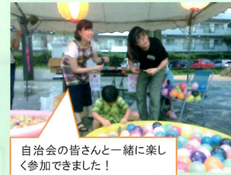
自治会の皆さんと一緒に楽しく参加できました！