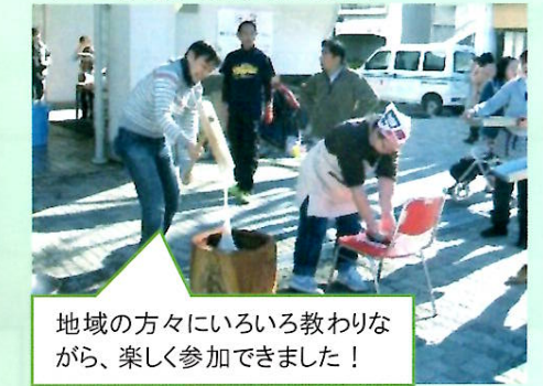
地域の方々いろいろな教わりながら、楽しく参加できました！