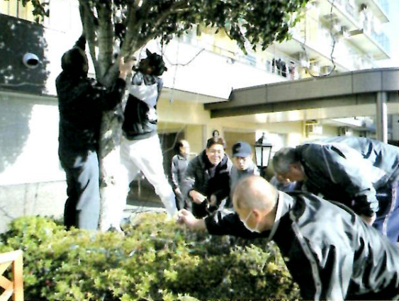
マンション大清掃 イルミネーション飾り付け