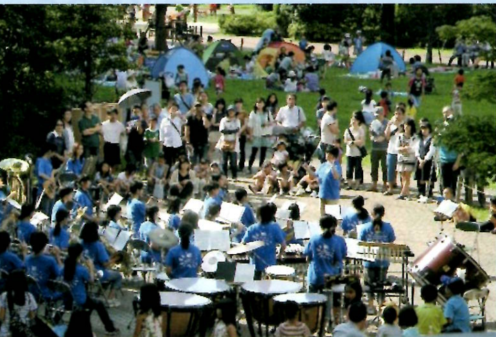
▲ビバ祭り(四中吹奏楽部)

私達ビバヒルズ自治会は、夏の「ビバ祭り」、冬の「もちつき大会」、春の「高尾山ハイキング」の三大行事を軸に、様々な活動を通して楽しく会員同士の親睦を深めています。シニア会や子ども会、サークル活動なども活発に行っています。