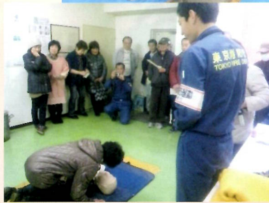
防災・救急救命訓練