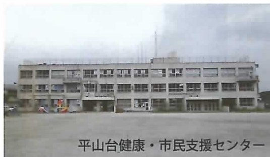
平山台健康・市民支援センター