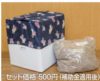
セット価格 500円(補助金適用後)