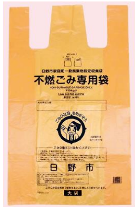
Sacs pour déchets non combustibles (orange)