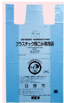
Sacs pour déchets plastiques (bleu)

◎ Si vous jetez des déchets combustibles, non combustibles ou en plastique dans des sacs non désignés par la ville, vos déchets ne seront pas collectés.