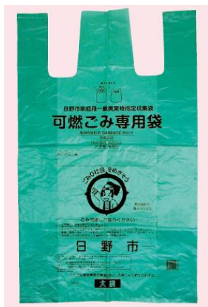
Sacs pour déchets combustibles (vert)

Utilisez les sacs poubelle pour les déchets combustibles, non combustibles et plastiques spécifiques de la ville, avant d'éliminer vos déchets.