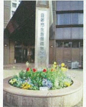
生活・保健センター 正面玄関の丸花壇