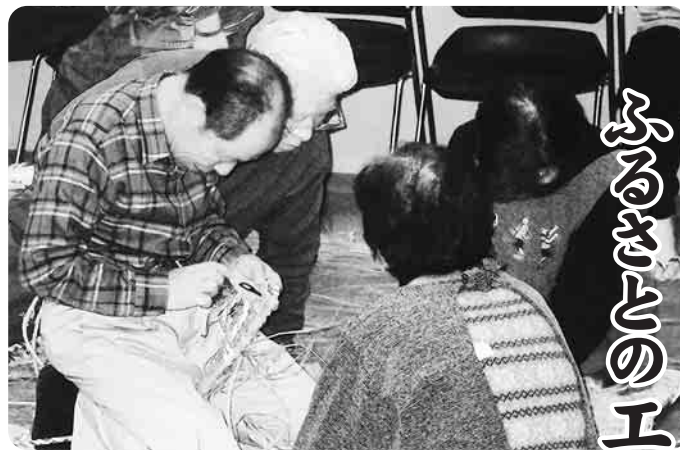
▲わらそうりの完成までもうひといき!