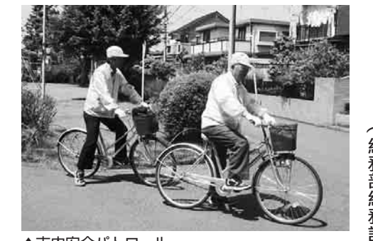
▲市内安全パトロール

地域で協力し合い 犯罪のないまちに 私たちの身の回りでは、空き巣、ひったくりなどの犯罪が増え、多くの方が被害を受けています。これらの犯罪を防ぐには、市民の皆さんが互いに見守り合うことが効果的です。 日野市の犯罪状況 日野市の犯罪状況は、グラフのとおりです。日野市から地域の中で協力し合いながら、防犯への意識を高めていきたいと思います。 普段の心掛けで防犯を！ 空き車狙い 防犯機器の設置と共に、外出時には近所で声を掛け合いましゅう。 ひったくり 被害