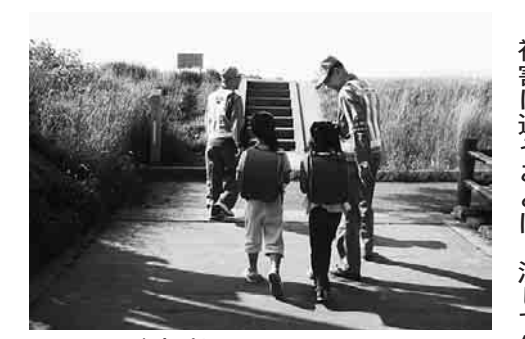
▲ひのっ子安全パトロール

警視庁生活安全総務課統計 平成16年3月末現在 強盗 0.2% 侵入窃盗 11.5% ひったくり 1.9% 車上狙い 8.4% 乗物盗 21.3% 置引き 3.6% 万引き 3.6% 性犯罪 0.4% 粗暴犯 2.5% その他 46.7% 日野市 犯を！ 空き車狙い 防犯機器の設置と共に、外出時には近所で声を掛け合いましゅう。 ひったくり 被害