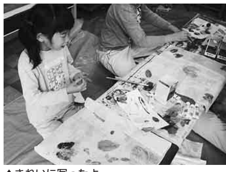
▲きれいに写ったよ

7月の児童館 ちびっこひろば「水遊び」 14日(水)午前10時30分～11時30分 / 乳幼児と保護者対象 / 水着、タオル、帽子、あれば水遊び用具持参 / ひの児童館(☎581・7675) よちよちチッコおいでよ 5日(月)午前10時30分～11時 / 乳幼児と保護者対象 / あさひがおか児童館(☎583・4346) ちびっこの日 7日(水)午前10時30分～正午 / 簡単なリズム体操・手あそびほか / 乳幼児と保護者対象 / しんめい児童館(☎583・6588) ちびっこのWA 2日(金)午前10時30分～11時30分 / 乳幼児と保護者対象 / 上履き持参 / ひらやま児童館(☎592・6811) ミステリー大会子ども実行委員募集 第1回実行委員会は29日(水)午前10時～正午 / 小3以上対象