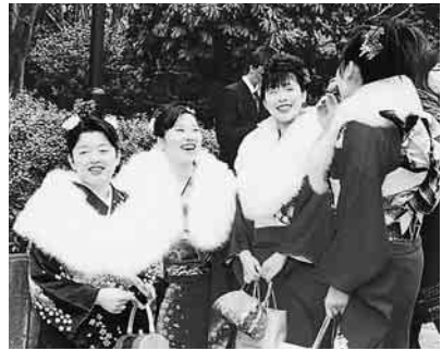
▲懐かしい笑顔がいっぱい

市では成人になったことをお祝いし、それぞれの新たなスタートを励ますために成人式を行