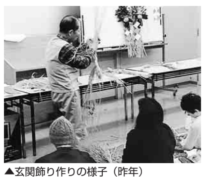
▲玄関飾り作りの様子(昨年)

12月10日(金)・17日(金)午後3時～4時30分/東部子ども家庭支援センターすまいる/生後3カ月～7カ月児と保護者で2日間とも参加できる方対象 以前参加した方は不可/先着10組/12月1日(水)午前9時から東部子ども家庭支援センターすまいる(☎586・1177)へ