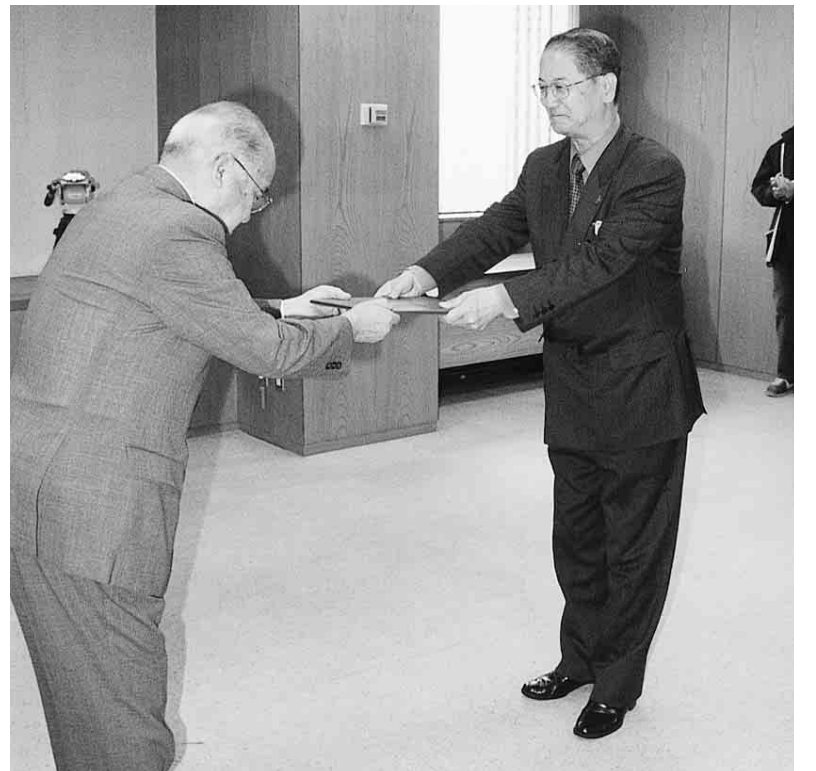
▲証書授与式（市役所にて）