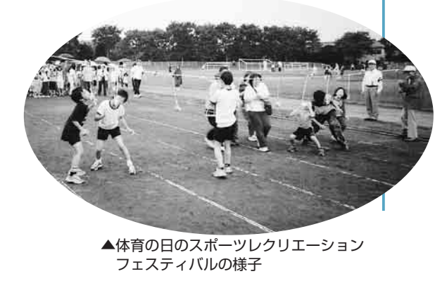
▲気軽にできるニュースポーツ「ビーチボール」