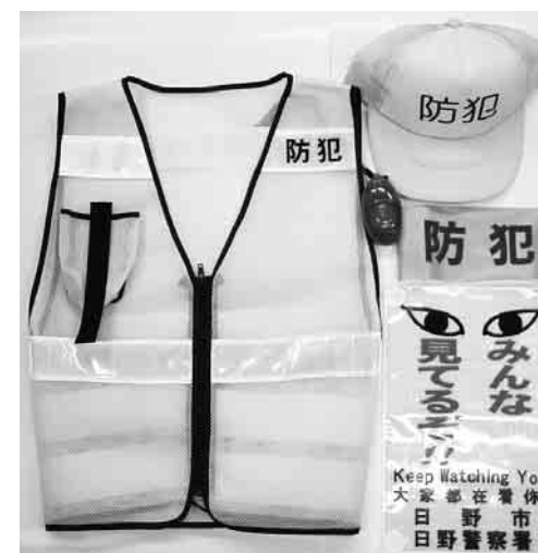
▲平成17年度貸与防犯用品

昨今、テレビや新聞で凶悪犯罪のニュースを多く目にします。市内でも、自転車盗難や痴漢行為などの犯罪が多発しています。これらの犯罪が凶悪犯罪へとつながることも考えられます。 防犯の基本は、日々の生活の中で一人ひとりが防犯に関する意識を持ち続けること。そして、とり近所が互いに見守りあえるよう連携を図ることです。 市では、安全で安心なまちづくりの一環として「地域防犯パトロール」を行う団体に対し、活動を支援する目的で、パトロールマニュアル、ベスト、帽子、腕章等(写真)を貸与しています。また、個人でも防犯活動にご協力いただける方には、買い物等の行き帰りに に地域防犯パトロールを実施していただいたり、愛犬家の方に地域防犯活動の協力(仮称「ワンワンパトロール」)をお願いしていきたいと考えています。 安全で安心なまち「ひの」を推進するため、皆さんのご協力をお願いします。 パトロール隊を募集! 防犯活動を行う町会、自治会等の団体を募集します。詳細はお問い合わせください。問合せ先は総務課