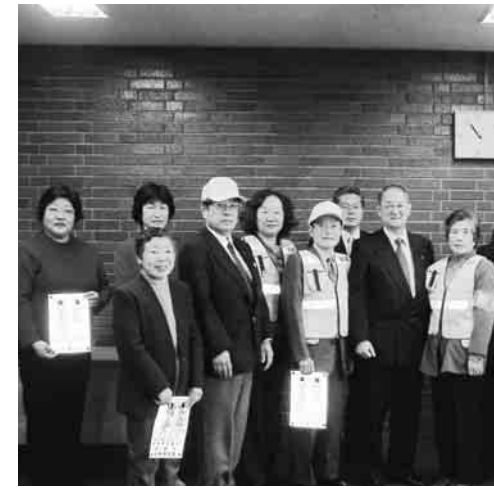
▲平成17年度防犯用品授与式(市役所にて)