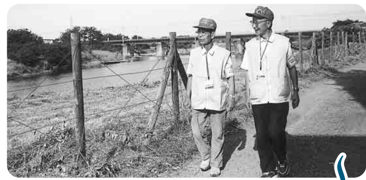
▲東光寺小校友会のパトロール