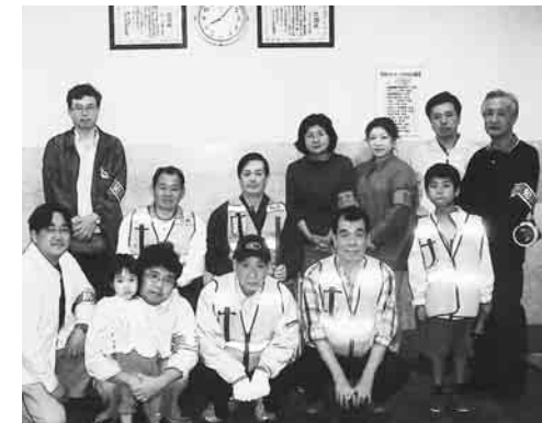
▲グランループ自治会の皆さん