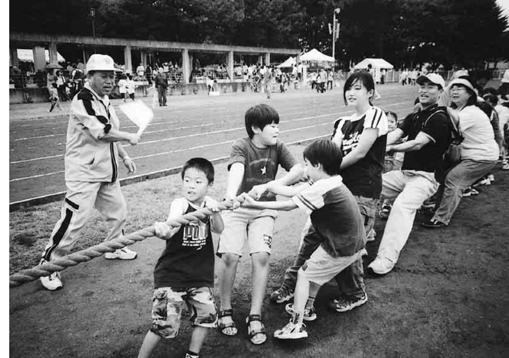
▲みんなで楽しくスポーツ(スポーツレクリエーションにて)

成人の週1回以上のスポーツ実践率が50%まで引き上げるよ うに、施策の展開を図ります 児童・生徒の70%が、学校・