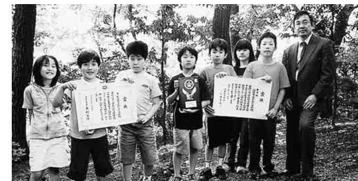
旭が丘小が「全日本学校関係緑化コンクール」で表彰

市郷土資料館(程久保550☎592-0981)では、この千歯扱きに限らず、各種の民具を身近に観察することができ、それらに触れながら、身近な民具が語る生活の歴史に、耳を傾けてみてはいかがでしょうか。