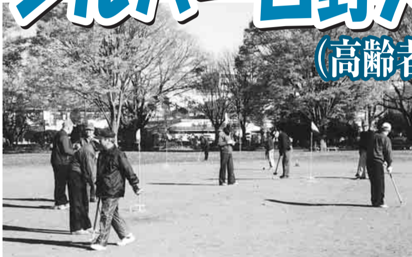
▲住み慣れた地域で安心して暮らせるまちづくりを推進します

このプランは、「ともに支え合うまちプラン(日野市地域福祉総合計画)」の高齢者部門の計画として位置付け、策定委員会やワーキングチームでの検討作業と、市民の皆さんからのご意見を踏まえ、修正して取りまとめたものです。