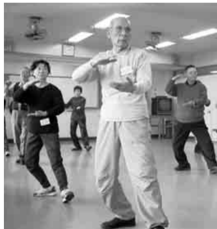
▲健康づくりの環境を整備します

「いきいきウォーキング」、「さわやか健康体操」、「楽・楽・楽トレーニング体操」、「パワーリハビリテーション」に参加することによって「健康の増進」「健康の維持」「仲間づくり」等ができる環境整備を図ります