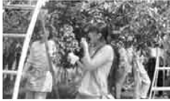
▲社員のレクリエーションに