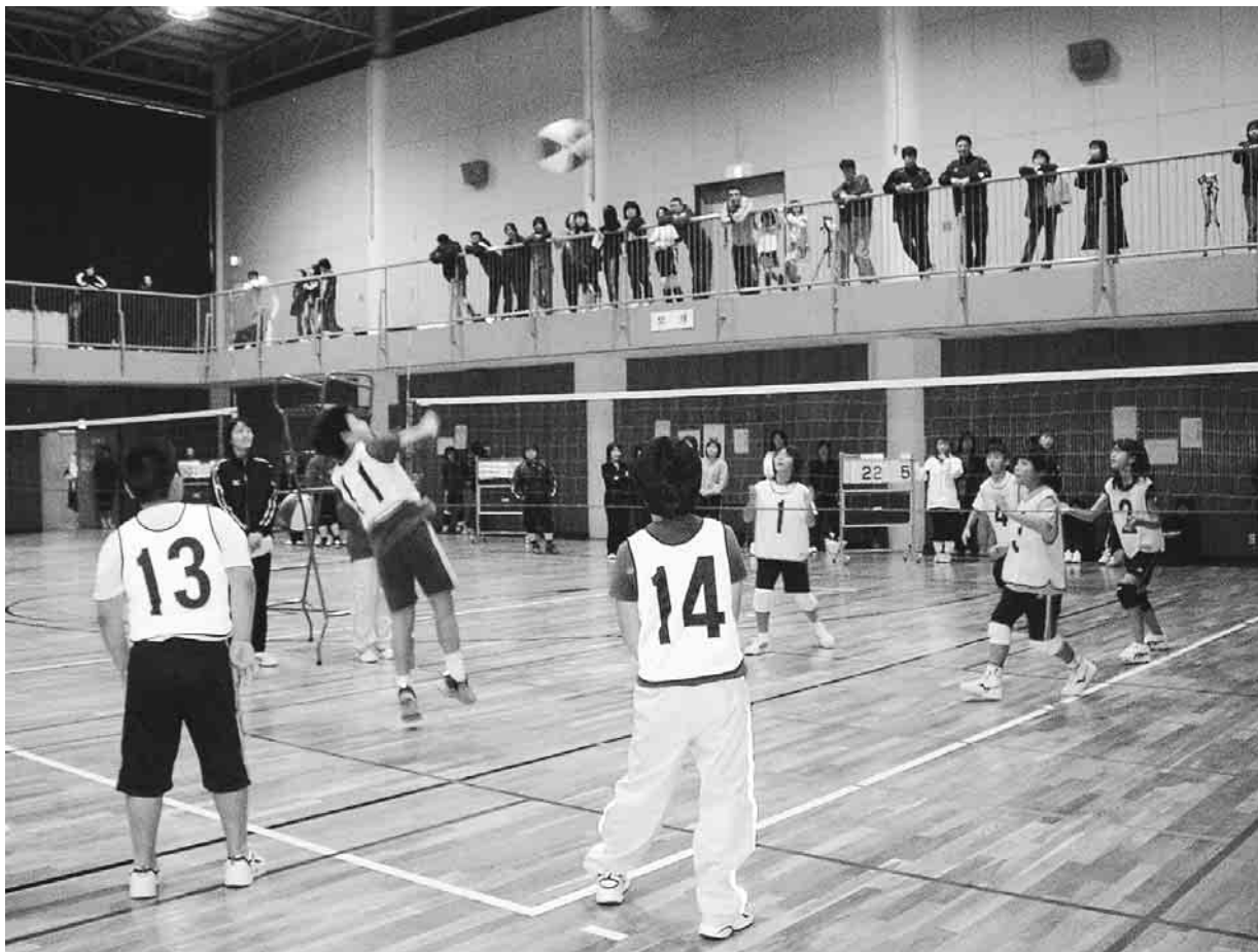
▲気軽に、楽しくでき、企画運営できるクラブをともに設立しませんか