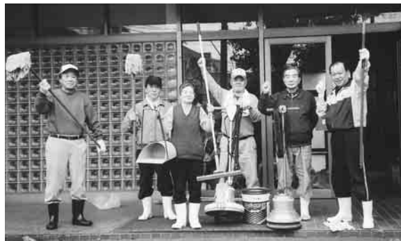
▲清掃班のスタッフ