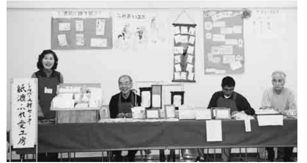
▲紙漉きの展示・販売活動

市内在住の60歳以上の方で働く意欲のある方が入会できます。説明会の日程は「広報ひの」毎月1日号でお知らせしています。