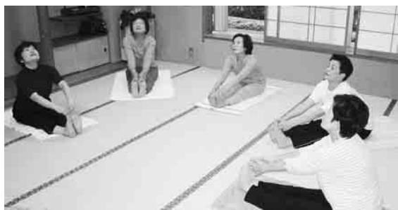
▲和室を使って、のびのびヨガ教室

利用の申し込みや問い合わせは同館窓口へ。 多摩平1の10の1(豊田駅北口徒歩1分) 駐車場なし