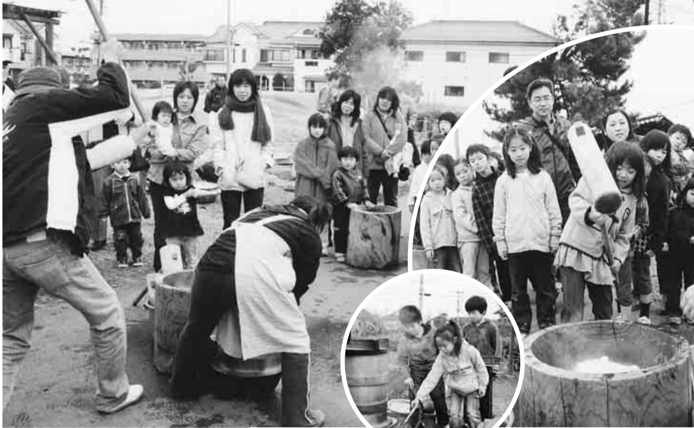
▲みんなで楽しくおもちつき(11月23日に行った万願寺中央公園収穫祭)