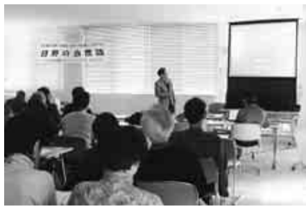
▲緑地と里山&農業の昔から現代までの変遷をひもときます

0011日野本町2の4の7日野市シルバー人材センター「PC教室」係(☎589・1248)へ