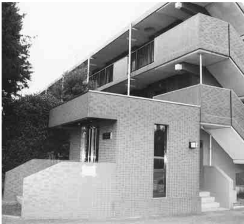
▲家族向けの公共住宅です（写真は第1かしの木ハイツ）