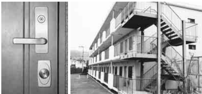
▲第2かしの木ハイツは2重ロック