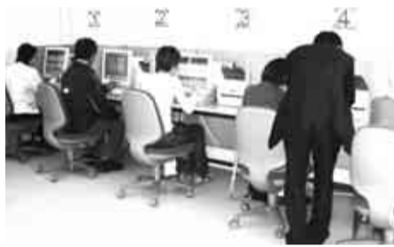
▲パソコンでハローワークの求人情報を見ることができます

昨年10月、福祉支援センターに、市とハローワーク八王子が開設した「ナイスワーク高幡」では、来場者の年齢や事情、希望職種などにあわせて、その方に適した企業を勧