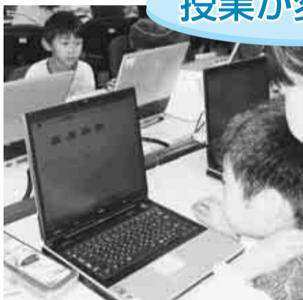
【算数】一人ひとりの学習状況に応じた個別学習で基礎・基本の徹底を図っています