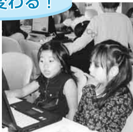
【総合的な学習の時間】体験したことを友だちや地域の人へ伝えています