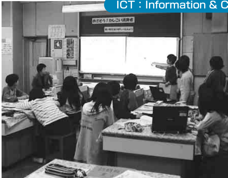
【家庭科】自分たちで調べたことを表現し学び合っています。先生も教材を大きく提示しています

平成18年度は、市内の全教員に、1人1台コンピュータを配備し、校務支援システムを導入して校務の情報化を図れるようにしました。また、全小学校に、各教室のICT機器の配備及び校内LAN整備を中心とするICT環境整備を実施しました。中学校の整備は平成19年度です。メディアコーディネーター制の導入