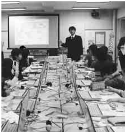
【社会】調べたり、体験したりしたことをみんなで分類してまとめています