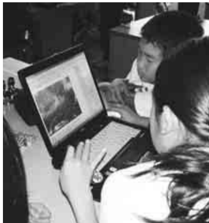
【理科】リアルタイムの情報を収集し、天気を予測しています