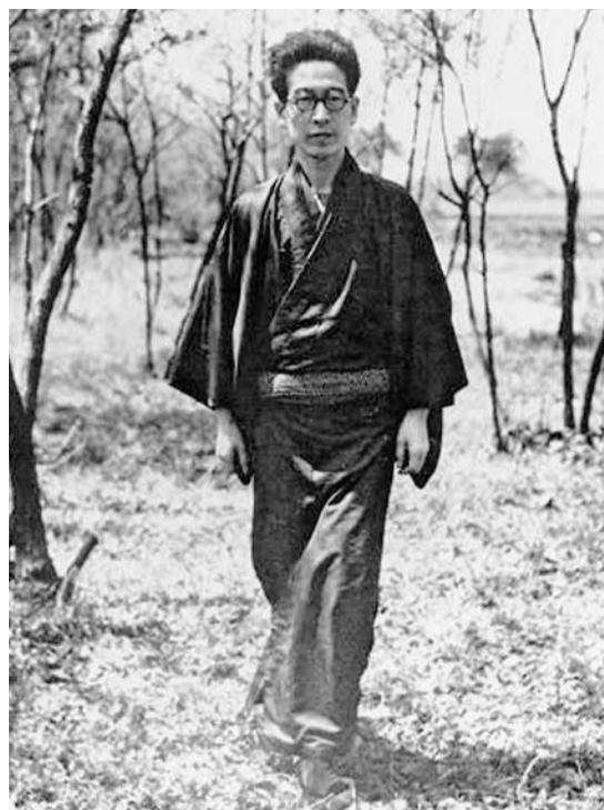
▲伊藤整 昭和27年撮影

12月1日(土) ~16日(日)、 市民会館展示室 ※月曜日 11日(火)は休館