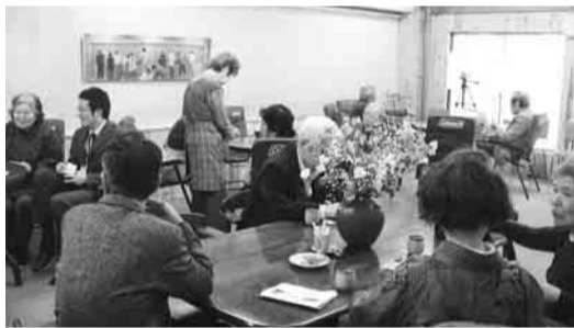
▲百草団地ふれあいサロン

以前から自主的な地域活動のなかで、高齢者が立ち寄れる場所として、南平ミニデイホームよりみち（南平6の22の2 ☎591・2980）、談話室ひなたぼっこ（大坂上4の20の18 ☎581・1383）でも行われています。