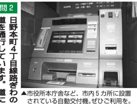
▲市役所本庁舎など、市内5カ所に設置されている自動交付機。ぜひご利用を。

皆さんがお気づきの点、改善すべき点など、さまざまご意見を「市民の声」「市政にひとことカード」、市ホームページからのEメールでお聞きしています。市では、皆さんから寄せられる声を受け止め、より住みやすいまちになるよう改善に取り組んでいます。今号では、寄せられたご意見の一部を紹介します。(市長公室市民相談担当)