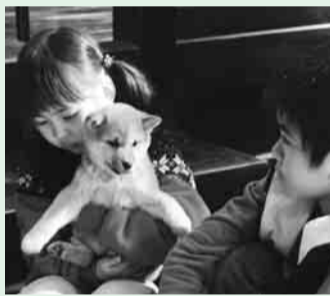
▲マリと子犬の物語

●「ひのっ子映画祭&平和の集い」日程 会場:市民会館大ホール 直接会場へ。入場無料