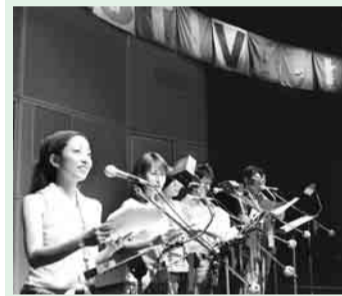
▲声優吹き替え体験

の夢や希望、平和の大切なことを見つけてください。 日程・下表参照 入場無料 /内容大人気の「ピングー」や「ひつじのショー」などの声優の吹き替え上映による海外作品と実話から生まれた感動作「マリと子犬の物語」などを上映 声優吹き替え体験 7月18日(金)までに往復ハガキで、住所、氏名、性別、学年、電話番号、体験してみたい理由、希望日を記入し、〒191 8686日野市役所文化スポーツ課「ひのっ子映画祭&平和の集い声優体験係」へ