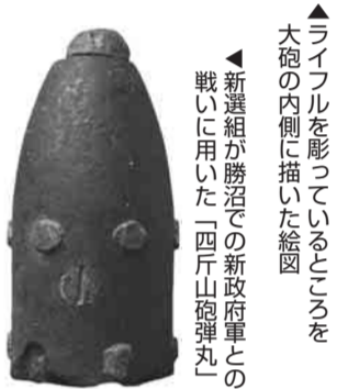
▲ライフルを形づけているように大砲の内側に描いた絵画。新選組が勝沼での新設砲臺との戦いに用いた「四斤山砲弾丸」