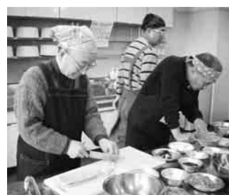
▲健康課で行っている「男の基礎料理塾」

①運動と食事をテーマに、保健師、栄養士などと青壮年期、若年期のメタボリックシンドロームの低減に努めます ②生活習慣病予防・改善の観点から行っている「食」に関する各種健康教室をさらに充実させます ③地域に講師を派遣するなど