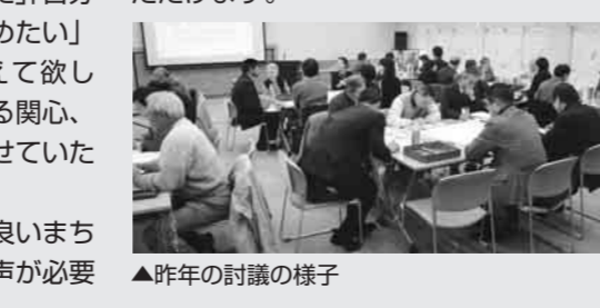
▲昨年の討議の様子

昨年、「私たちが創る安全・安心できれいなまち」をテーマに、37人の市民の皆さんと2日間の話し合いをしました。 参加した皆さんからは、「面白い取り組み。日野市に関心が持てた」「自分が地域で出来ることからはじめたい」「討議後の推移と結論を教えてください」など、今後の市政に対する関心、期待についての声を数多く寄せいただきました。 そのような声に応え、より良いまちにするためにも、今あなたの声が必要