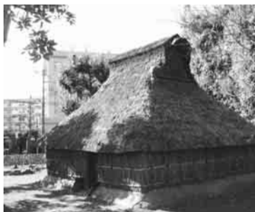
▲復原住居で昔の人の暮らしを体験

新選組のふるさと歴史館から 西洋流砲術演武 8月3日(日)午後1時30分~2時 小雨実施/日野中央公園