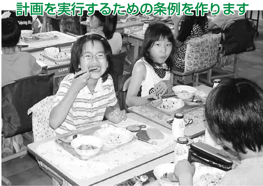
▲学校給食には、安全安心でおいしい日野産野菜を利用しています