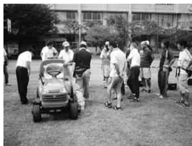
▲芝刈機講習会の様子

芝生開きが行われました。9月6日に、芝生開きの式典が東光寺小で行われました。式典の第一部は、みどりの学舎応援隊の紹介やテ