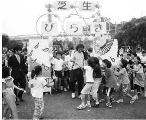
▲東京ヴェルディのラモス瑠偉さんとミニサッカーを楽しむ子どもたち