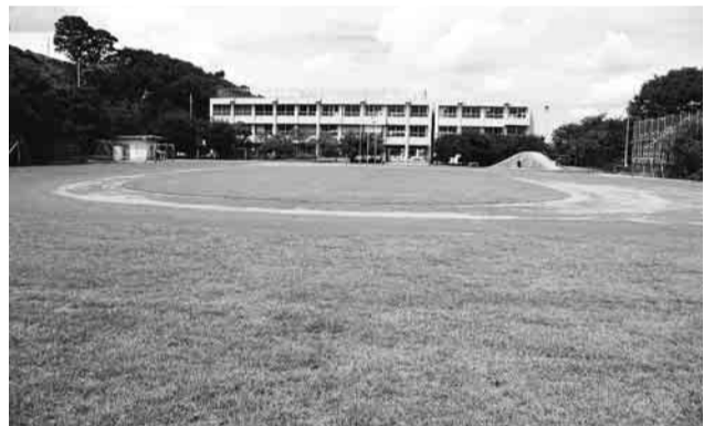
▲校庭約3分の1 (2,142㎡) を芝生化した東光寺小

9月6日に、芝生開きの式典が東光寺小で行われました。式典の第一部は、みどりの学舎応援隊の紹介やテ