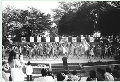
▲こどもたちによるロックソーラン節

10月19日(日)午前10時30分～午後2時30分／日野中央公園 車での来場不可。雨天の場合は中央公園・七小体育館・七小児童クラブ／おもいっきり遊ぼうコーナー、じっくり楽しもうコーナー、おもしろいステーション、ふれあい動物園(雨天中止)／おもちゃ病院など／乳幼児(18歳対象)／ひの児童館(☎581・7675)