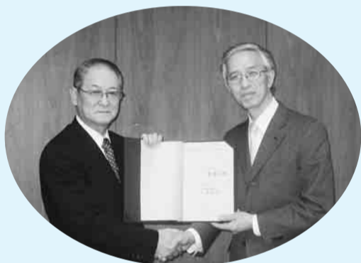
▲市長（左）とUR都市機構東日本支社社長が調印