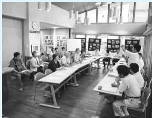
▲多摩平の森自治会、UR都市機構、市との勉強会