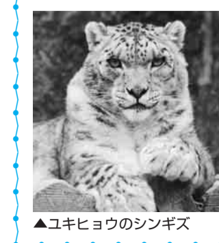
▲ユキヒョウのシンギズ

水泳が苦手な方のための水泳教室 2月25日(水)～27日(金) 午前11時30分～午後1時②午後6時～7時30分/各15人/4千500円