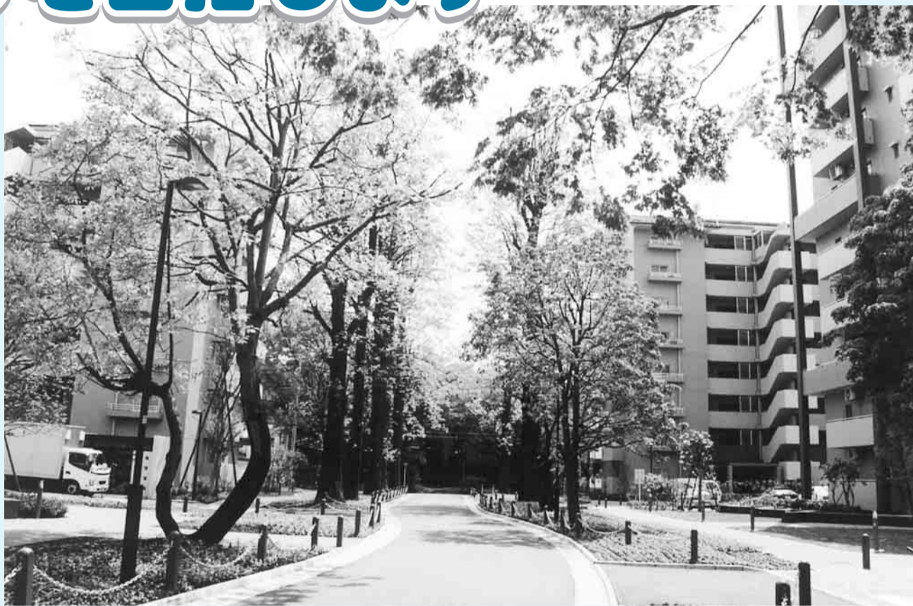
▲整備されたまち並み